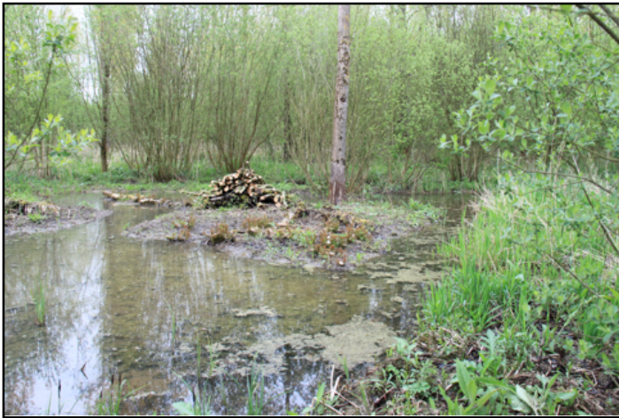
Mare © Céline Fontaine