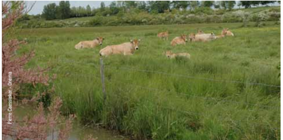
Pierre Caessteker - Onema

La restauration de la continuité écologique permet également une amélioration physico-chimique des eaux en favorisant l'autoépuration des rivières - suppression des zones d'anoxie, modération des bouchons vaseux, meilleure oxygénation, refroidissement, limitation de l'eutrophisation. L'enlèvement des ouvrages depuis l'estuaire jusqu'à la source permet donc aux rivières de recouvrer leur capacité d'auto-guérison.