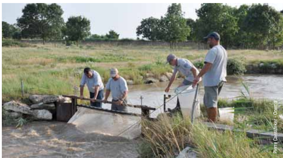
Suivi des entrées d'alevins dans les marais de Terre d'Oiseaux (estuaire de la Gironde)

Il est également instructif de suivre une zone humide littorale fonctionnant naturellement, sans ouvrage de gestion hydraulique : sur l'étang de Villepey, propriété du Conservatoire du littoral géré par la ville de Fréjus, les inondations de 2010 et 2011 ont provoqué l'ouverture spontanée du grau et une brèche à la mer, avec de fortes conséquences socio-économiques et écologiques. Le suivi physico-chimique du milieu (salinité, température, oxygène dissous) permet de caractériser la dynamique en cours sur cette zone humide : un an après l'inondation, la salinité était de 29g/l, contre 9 g/l