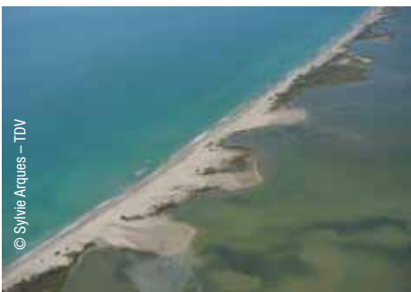
Littoral de Maguelone

Les laboratoires de recherche apportent une contribution fondamentale en développant des modèles et des outils d'analyse. En partenariat entre le Service hydrographique et océanographique de la marine (SHOM) et l'IGN, le projet Litto3D® établit un modèle altimétrique continu terre-mer à partir des relevés du système Lidar (mesure de distance par détection de lumière) en application topographique (au sol) et bathymétrique (en mer). Ce référentiel géographique du littoral fournit des données de référence sur l'évolution du trait de côte pour l'aménagement du territoire et la prévention des risques.