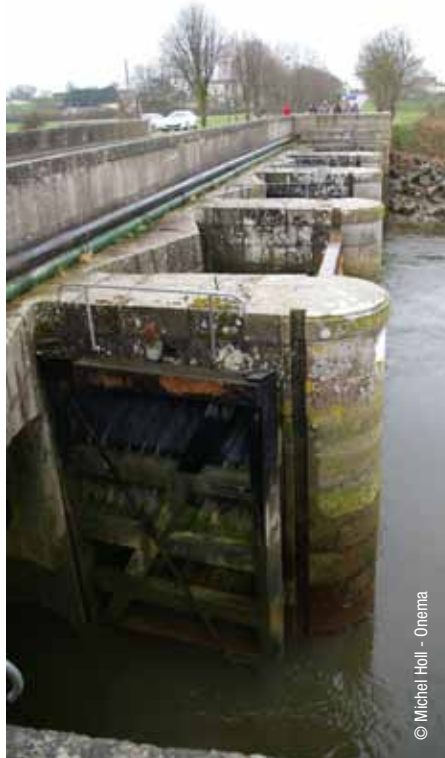
Ouvrage à la mer sur la Vire

« Les vantelles, dont l'ouverture peut se gérer à distance, donnent de bons résultats : en baie des Veys, sur la Vire, deux vantelles sont placées à mi-hauteur sur les portes de la rive gauche, privilégiées pour le passage des civelles ; la vantelle de fond est conservée pour évacuer les sédiments. Le dispositif sera validé par des comptages » explique André Berne (Agence de l'Eau Seine-Normandie).