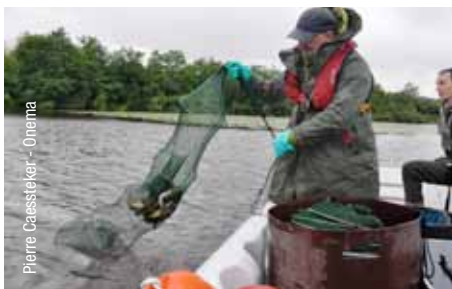
Pêche de suivi par les agents de l'Onema sur le site index anguille de Soustons (40)

un obstacle majeur pour les poissons migrateurs, adapter les modalités de franchissement de ces ouvrages en faisant preuve le plus possible d'une gestion écosystémique est essentiel. Pour les civelles, il faut aussi éviter leur concentration aux pieds des ouvrages, cette situation favorisant les actes de braconnage.