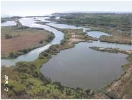
Etang de Villepey

auparavant. Depuis, selon le Pôle relais Lagunes méditerranéennes, le retour au fonctionnement naturel de l'écosystème est en cours, sans intervention extérieure.