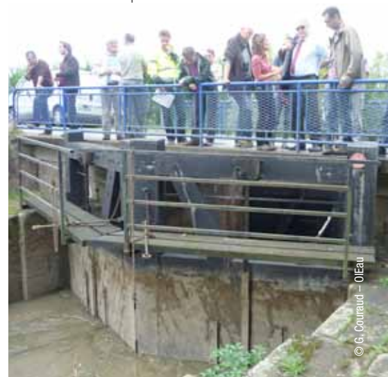
Portes à flots

Les services rendus par les zones humides sont dépendants de leurs usages : approvisionnement en eau, production agricole, piscicole et conchylicole, sans oublier les services touristiques et culturels.