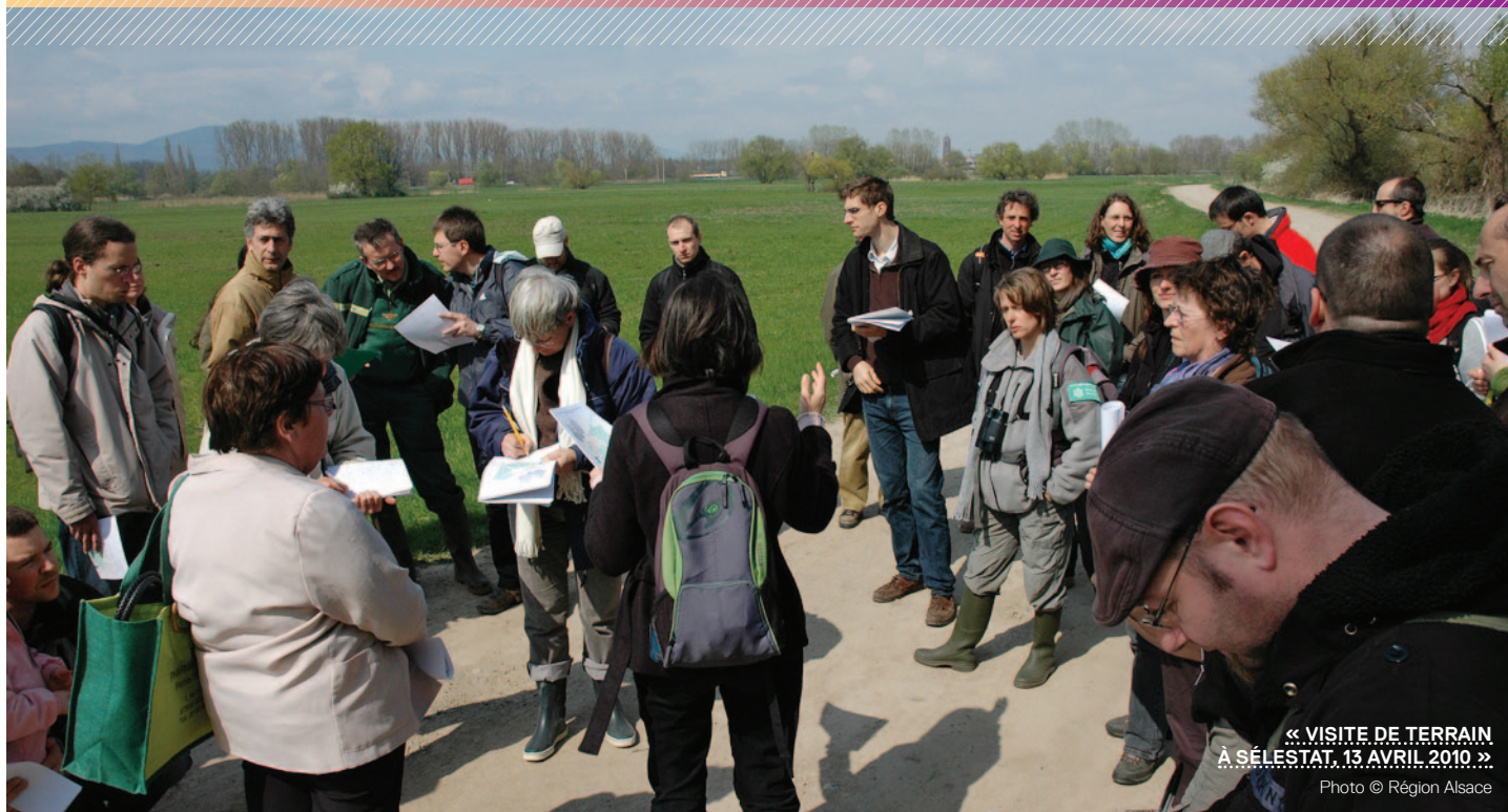
« VISITE DE TERRAIN À SÉLESTAT, 13 AVRIL 2010 »