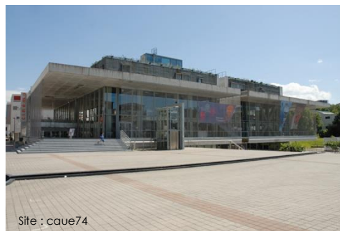
Site : caue74